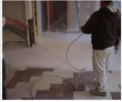
Aplicación del TEMP-COAT 101 en el suelo de baldosas.