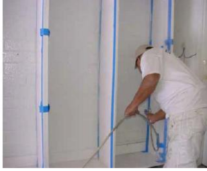
Aplicación del TEMP-COAT 101 en las paredes sin aislamiento.